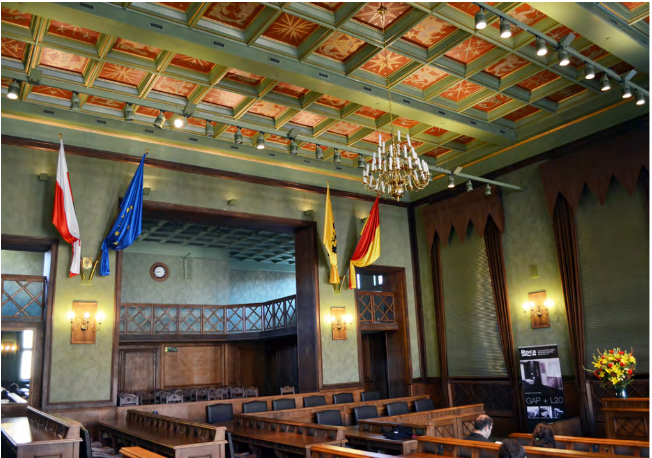
Sala Rady Miasta Wrocławia w przededniu obrad