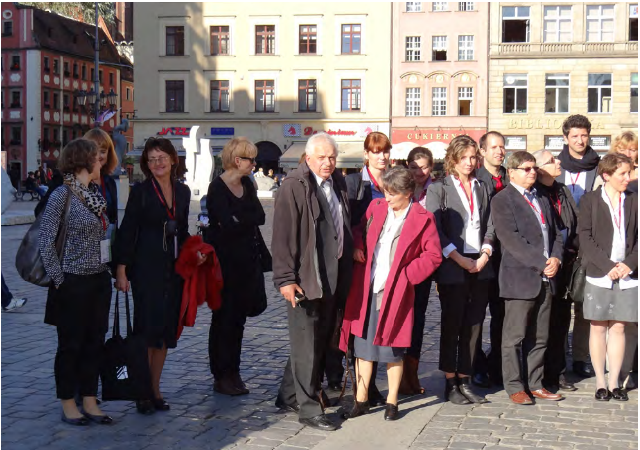
Zdjęcie grupowe uczestników konferencji przy Wrocławskiej Fontannie