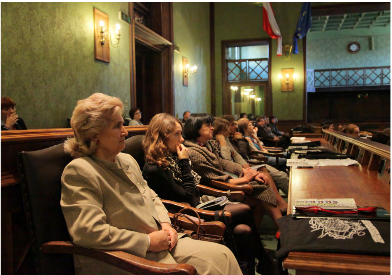
Goście konferencji podczas obrad