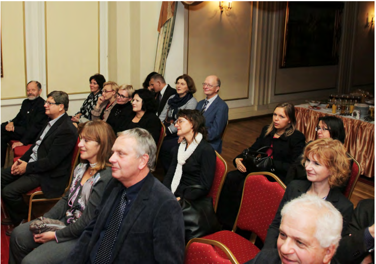
Migawki z koncertu kwartetu Continuo