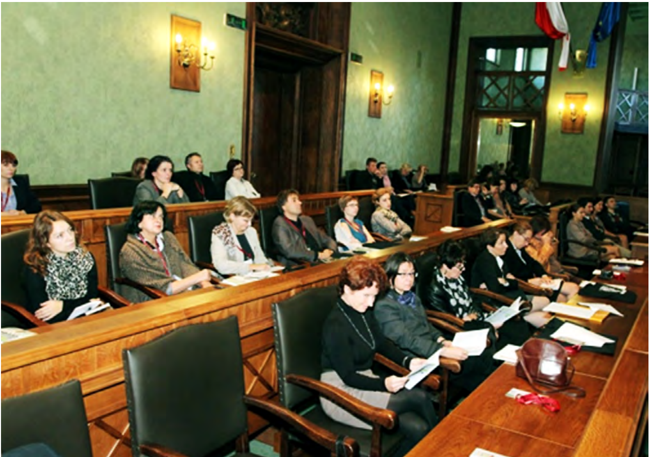
Goście konferencji podczas obrad