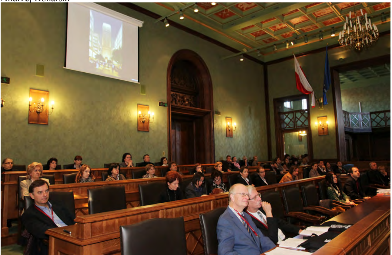
Goście konferencji podczas obrad