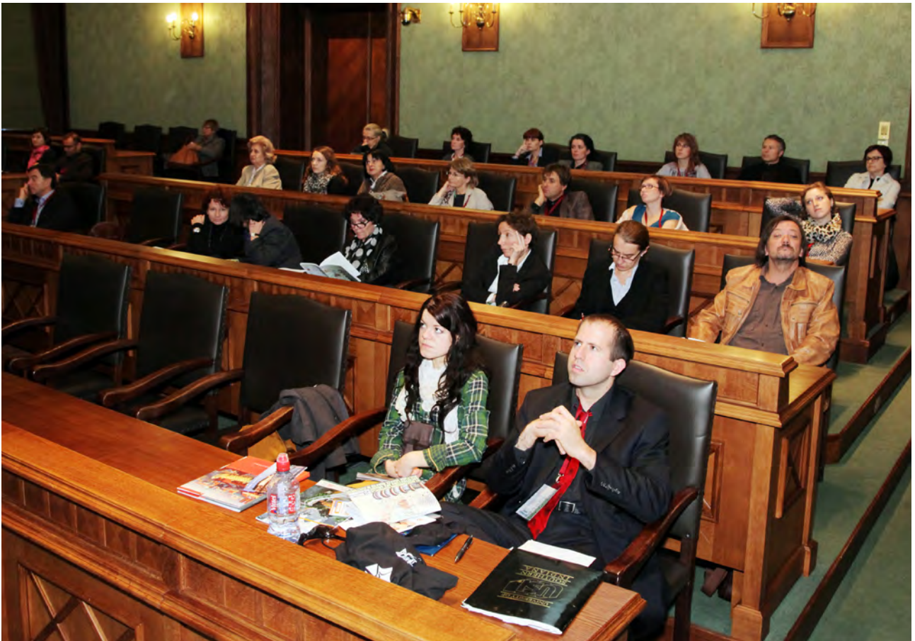
Goście konferencji podczas obrad