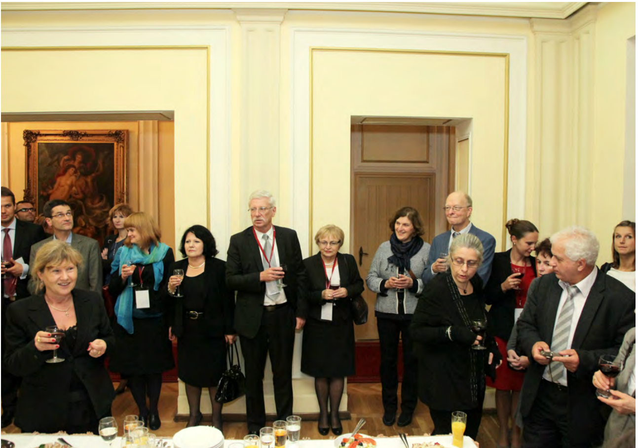
Goście konferencji podczas uroczystej kolacji