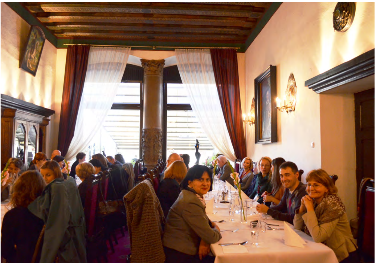
W oczekiwaniu na uroczysty obiad w Sali Królewskiej w Restauracji Dwór Polski