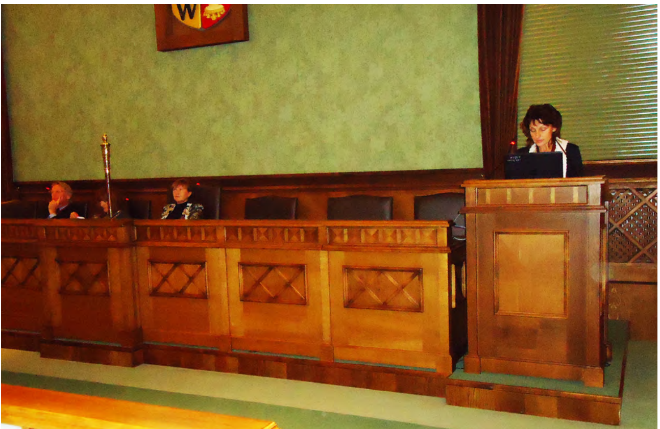
Referat wygłasza Prof. Svitlana Smolenska (Charków) Problems of Preserving the Historic Image of Kharkiv - the 'first capital' of Ukraine