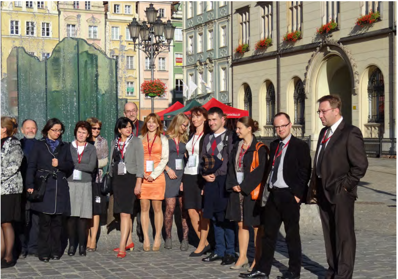
Zdjęcie grupowe uczestników konferencji przy Wrocławskiej Fontannie