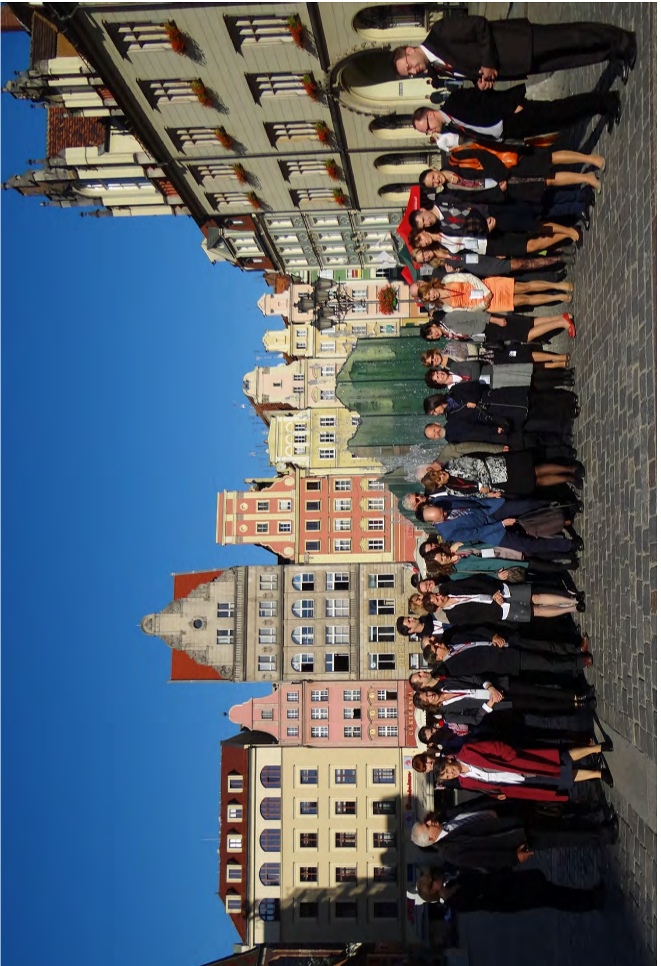
Zdjęcie grupowe uczestników konferencji przy Wrocławskiej Fontannie