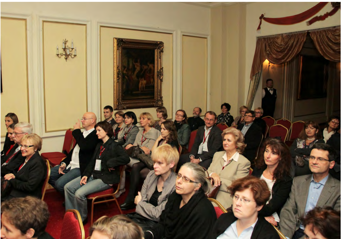
Migawki z koncertu kwartetu Continuo