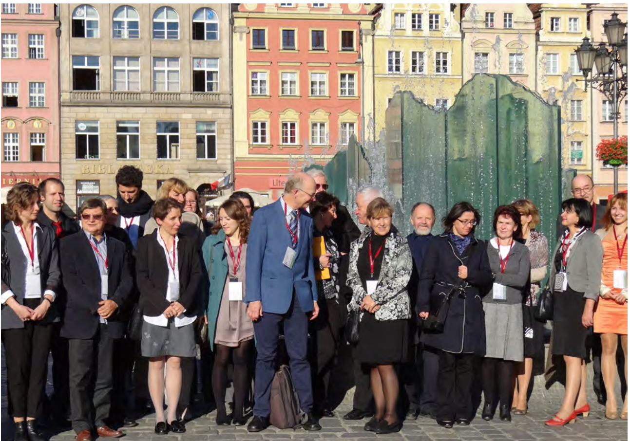
Zdjęcie grupowe uczestników konferencji przy Wrocławskiej Fontannie