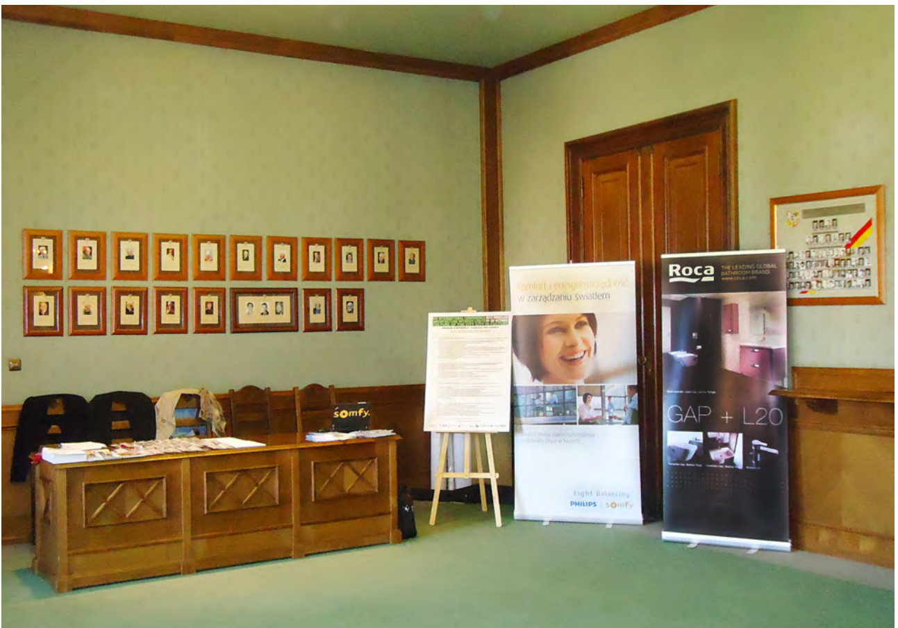
Biuro konferencji z banerami głównych sponsorów ROCA i PZP-POPiB