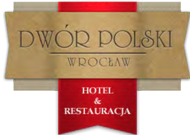
W oczekiwaniu na uroczysty obiad w Sali Królewskiej w Restauracji Dwór Polski