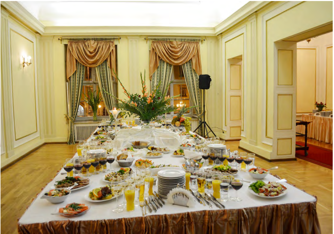
Przygotowania do uroczystej kolacji w Restauracji Dwór Polski