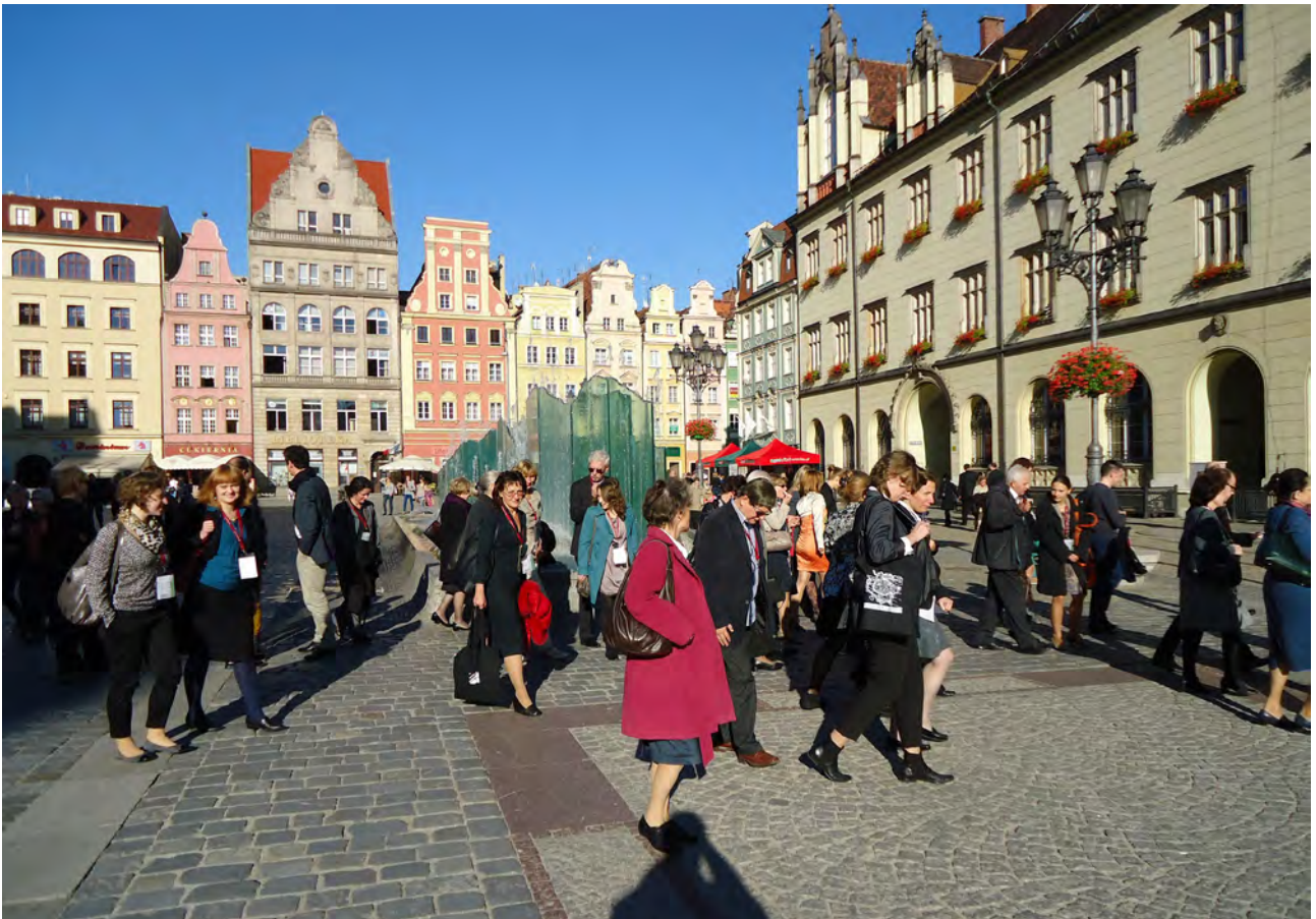
Uczestnicy konferencji zmierzają z Restauracji Dwór Polski do sali obrad w Ratuszu