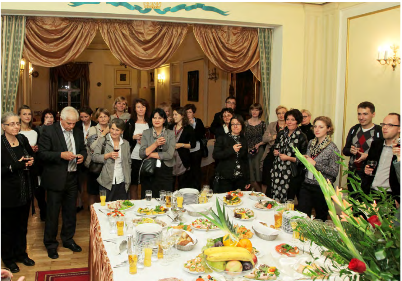
Goście konferencji podczas uroczystej kolacji