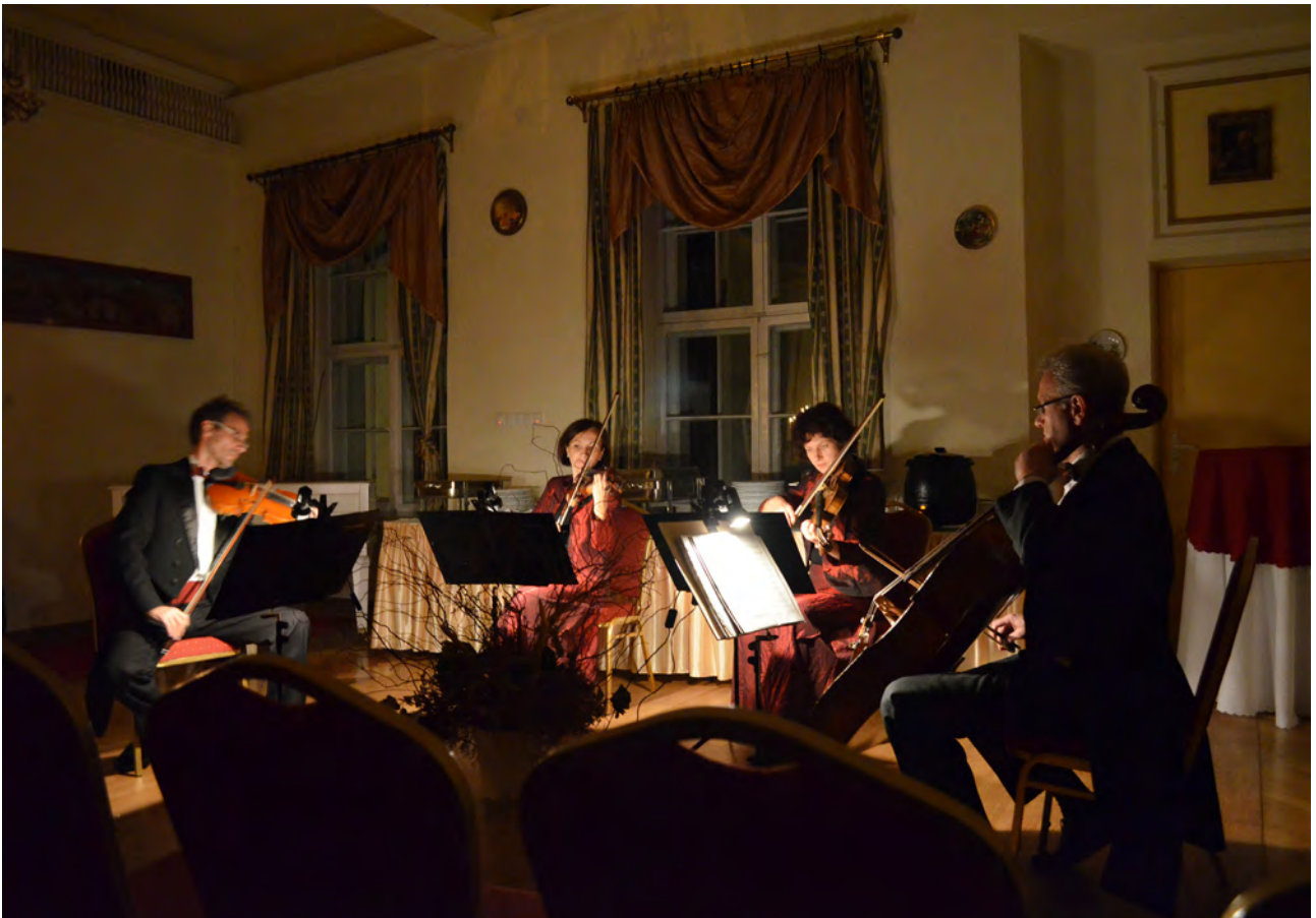
Koncert kwartetu Continuo