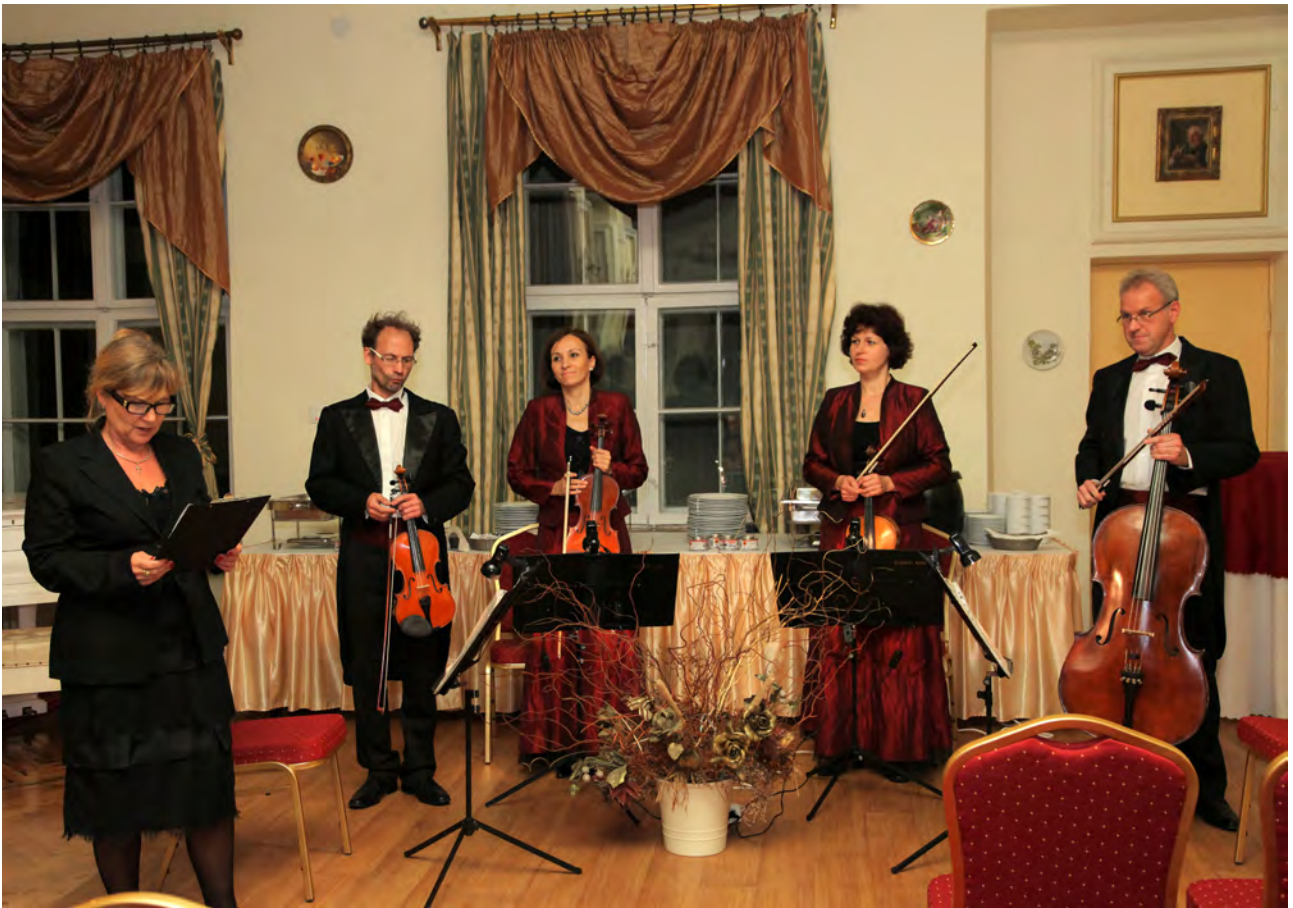
Prezentacja kwartetu smyczkowego Continuo